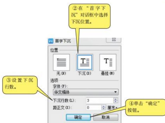
图4-3 “首字下沉”设置对话框