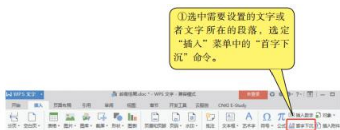
图4-2 选定“首字下沉”命令