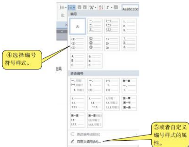
图4-6 “编号”设置对话框