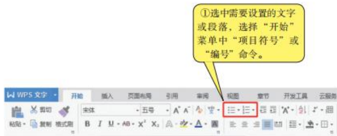
图4-4 选择“项目符号”或“编号”命令

第四步： 选择“项目符号”或“编号样式”、“自定义项目符号”或“自定义项目编号”