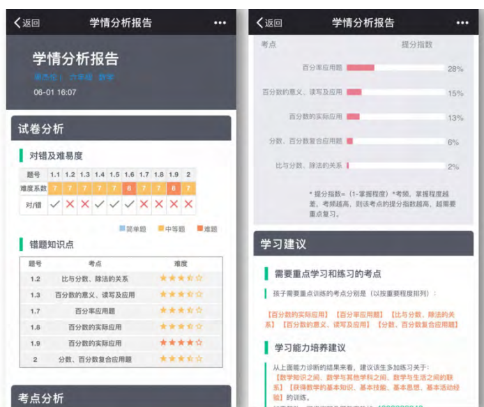
图 3：个性化学情分析报告

第三，打印输出：为了响应教育部关于纸质作业的相关要求，我们支持学生的学情报告和个性化学习方案打印输出。在个性化学习方案中，我们提供了错题的举一反三强化练习，学生可以通过这些题目进一步巩固薄弱知识点。