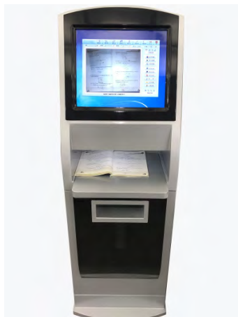
图 2：基于班级的部署方案

无论哪种部署方案，数据采集、分析和输出学情报告的流程是一致的，都包含如下三个部分：