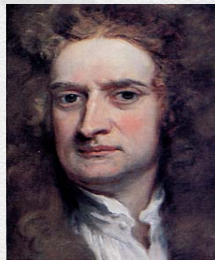
Isaac Newton (1642-1727)

例： 牛顿对苹果之落地 瓦特对水壶盖之跳动 莱特兄弟钟情飞机 巴甫洛夫研究狗之唾液